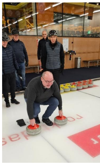
Zunftherr und Stadt- Ammann „Beidhändig“