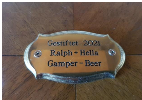
Detailansicht: Stifter Plakette Ralph und Hella Gamper