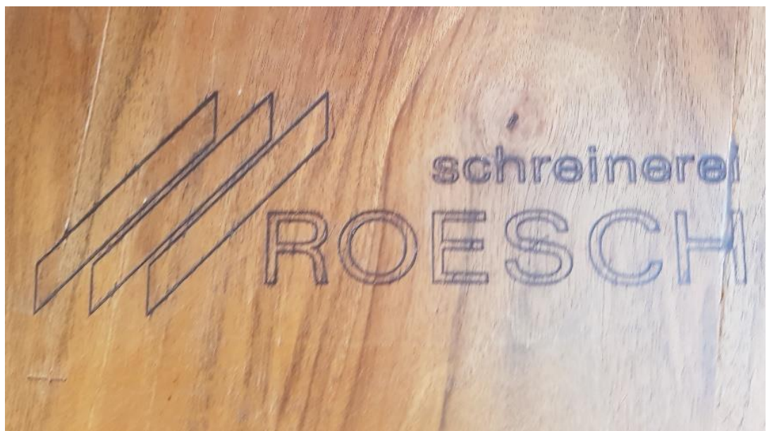
Detailansicht: Logo Schreinerei Roesch