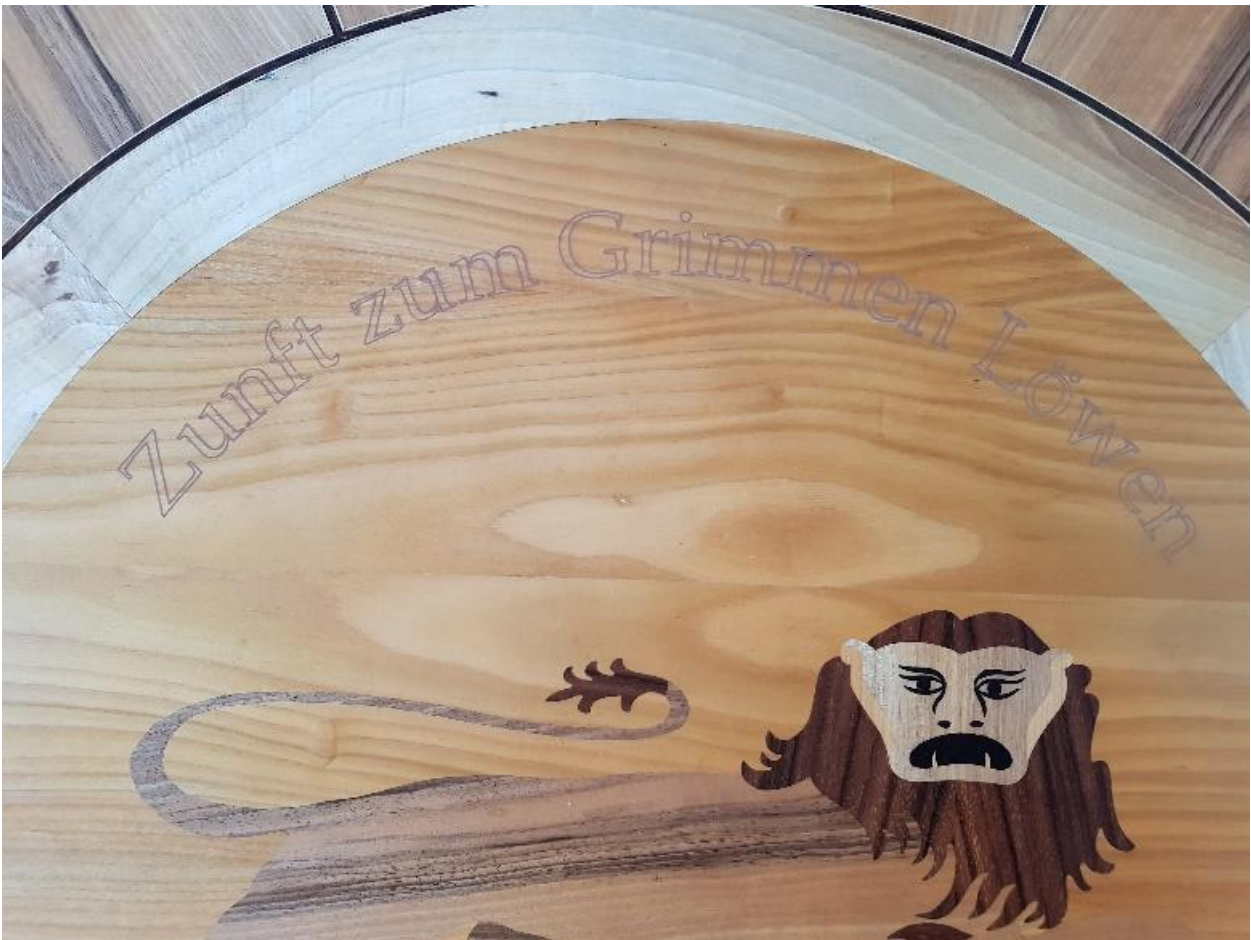
Detailansicht Schritzug: Zunft zum Grimmen Löwen