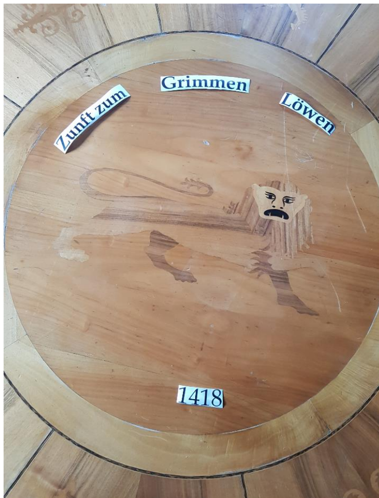
Vorschlag zur Ergänzung des Tisches mit «Zunft zum Grimmen Löwen» und Gründungsjahr 1418.