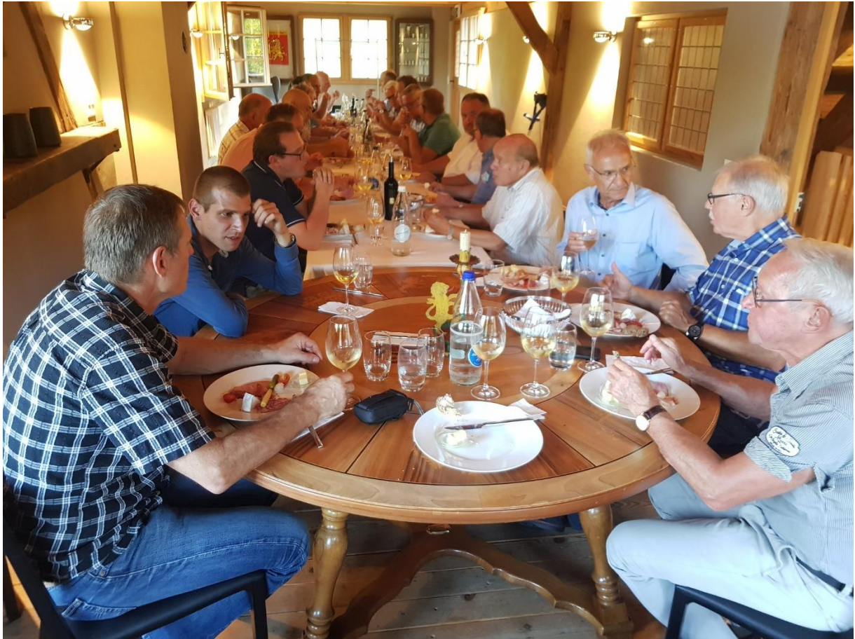
Die versammelten Zünfter in der Zunftstube es fehlt der Fotograf Ralph Gamper