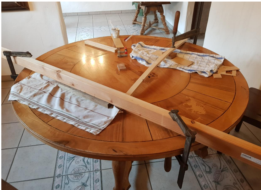
Reparaturarbeiten an den Intarsien

Als erster Schritt wurde in Zusammenarbeit mit Christoph Maurer, Schreiner aus Schlattingen – Diesenhofen die Problemstellen aufgenommen und versucht eine Analyse der verwendeten Materialien zu machen. An etlichen Stellen hatte sich das Furnier durch Wasserschäden abgelöst und aufgebogen. Zudem durchzogen unzählige tiefe Furchen die Tischplatte. Die tiefen Furchen wurden befeuchtet, was ein wiederaufquellen des Holzes bewirkte. Dadurch musste das Furnier weniger tief abgeschliffen werden. Unter Verwendung des bei der Furnierherstellung verwendeten Fischleims, wurden diese mittels eines heissen Bügeleisens und Druck, wieder in die richtige Position gebracht. Der mit einer Spritze unter das Furnier gebrachte Leim benötigte jeweils gut einen Tag bis er ausgehärtet war. Es gingen beim Anpressen etliche Bügeleisen zu Bruch. Der ganze Vorgang dauerte Wochen, da jeweils immer nur kleine Flächen bearbeitet werden konnten. Christoph Maurer's Original DDR-Bügeleisen konnte ich zum Glück dank einem Fund bei Ebay im Internet wieder ersetzen. Die Dame aus den neuen Bundesländern wunderte sich sehr, wieso ein Schweizer unbedingt ihr altes Ossi Bügeleisen ersteigern wollte!