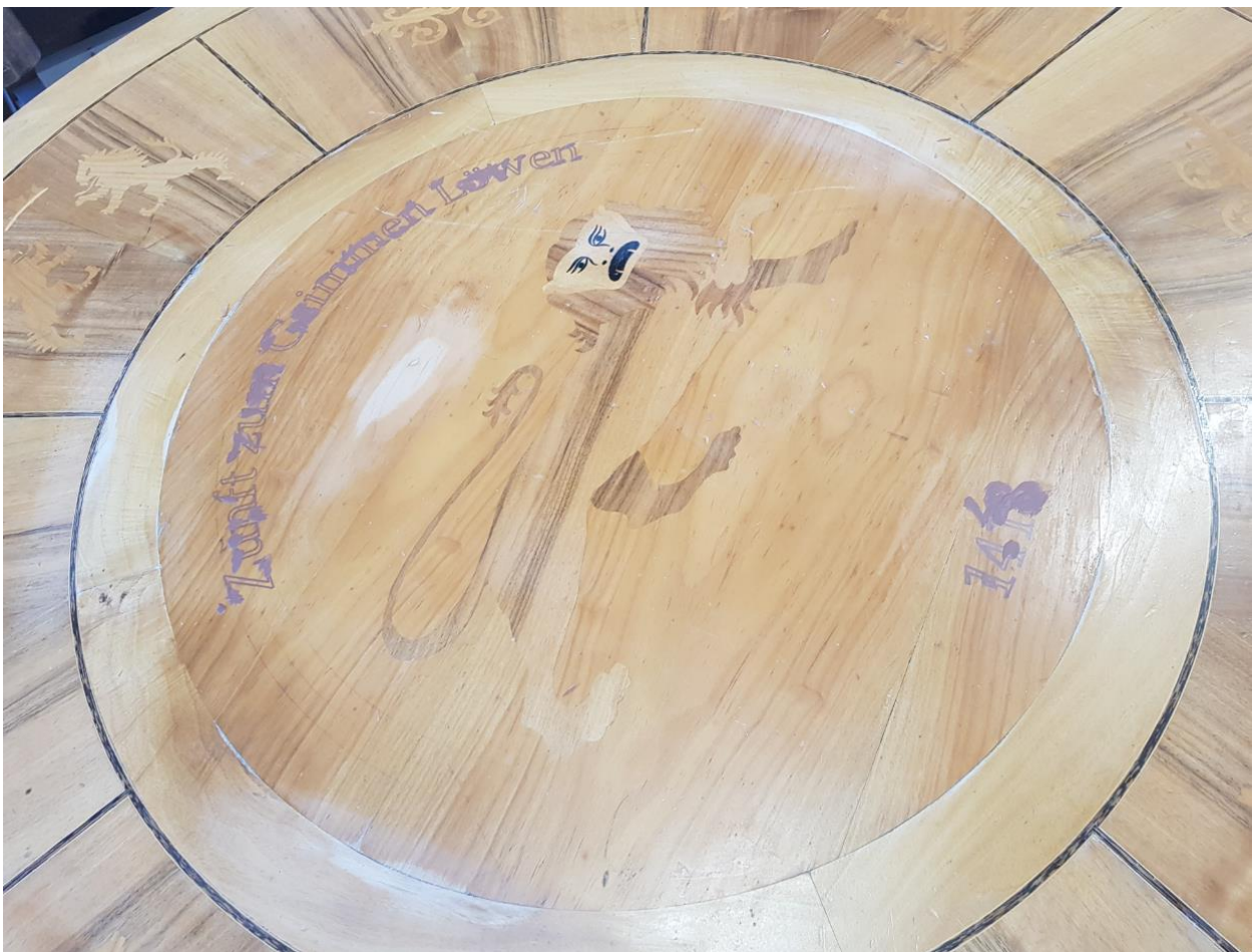
Die gravierte Tischplatte vor dem Schleifen und abziehen des überstehenden Hartwachs